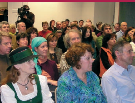
TdU.at – Videokonferenz im Raum GRÜN bei den „Tagen der Utopie“