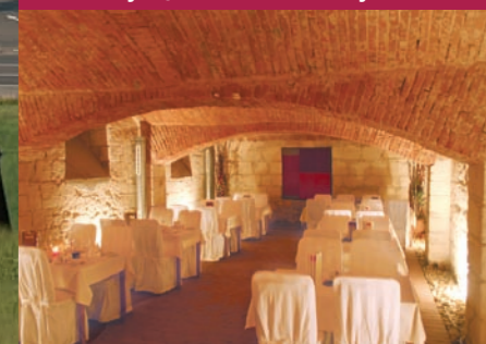
DER KELLER – der besondere und stilvolle Rahmen für Ihre Veranstaltung