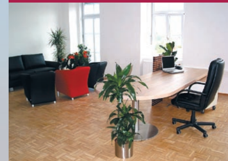
Schöne und freundliche Arbeitsplätze im Globalen Dorf Kirchbach