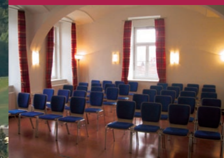
Die Stimmung im Seminarraum ROT