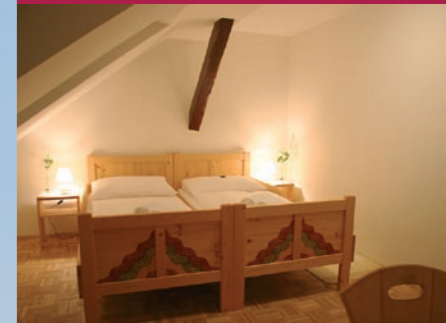
Das Vulkanlandzimmer im Haus KB5 aus Hölzern der Region

Kirchbach liegt im Zentrum der Steirischen Weinstraßen der West-, der Süd- und der Oststeiermark und ist der ideale Ausgangspunkt für Ihre Ausflüge in die Landeshauptstadt Graz, die Steirische Schlösserstraße, ins Steirische Vulkanland und ins Steirische Thermenland.