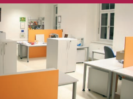
Impulszentrum.KB5.at – Mieten Sie sich ein Büro für Ihre Firma im Haus KB5