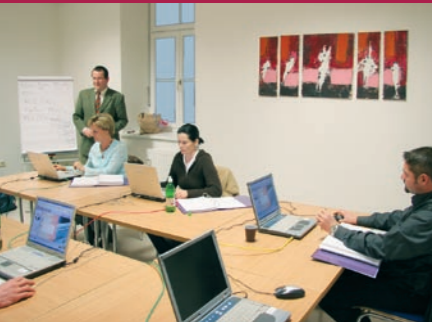
LINUXakademie.at – Kurs im Raum WEISS: Open Source – Open Mind